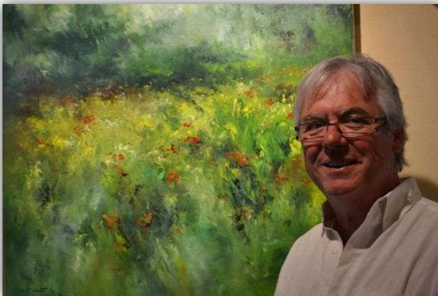
L'une des toiles de Denis Canut.

Depuis mardi et jusqu'au 12 septembre, l'Office du tourisme expose une sélection des œuvres de Denis Canut. L'homme, qui a choisi la profession de peintre à l'âge de 20 ans, compte aujourd'hui près de 40 années de carrière. Cet amoureux de la vie et de ses surprenantes facettes pratique la peinture figurative en Bourgogne, dans le respect de la grande tradition de « cet art magique ».