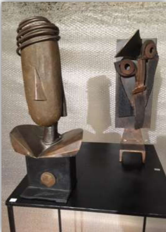
Femme de pierre

Il veut tout simplement décorer un peu de notre monde pour que l'on se sente bien.