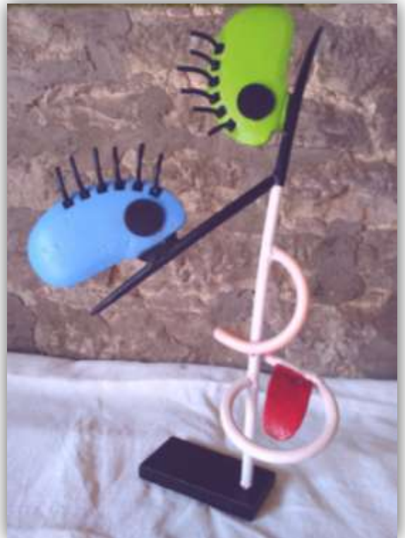
Elle m'a tiré la langue