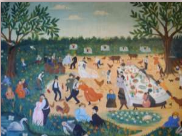
Le mariage à la campagne, Lettron

Et 120 ex-voto sont exposés depuis quelques années : 60 de la collection Jacques Lagrange confiée au musée et 60 de la collection Jennine et Jacques Geysant .