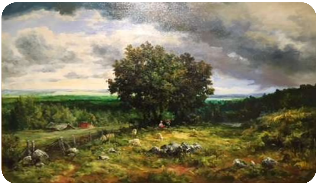
Le Haut Folin 72x120

Nombreuses médailles d'or et prix de peintures.